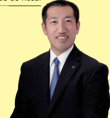
湖西市市長 影山 剛士 (かげやまたけし) Prefeito da cidade de Kosai Takeshi Kageyama

Saudações do Prefeito da cidade de Kosai 湖西市は、令和4年1月1日に市制施行50周年を迎えました。これまで市の発展を支えてきた先人たちの功績を讃えるとともに、50周年を契機に未来に向けて湖西市の魅力発信と持続可能な発展につながるような事業を進めてまいります。わたしたちの住むまち湖西市は静岡県最西端に位置し、浜名湖と遠州灘、湖西連峰に囲まれた自然あふれる美しいまちであり、自動車などの製造業が盛んな「モノづくりのまち」です。今後の人口減少と少子高齢化に対応するため、「職住近接」をキーワードに、「安全・安心、医療福祉」、「子育て・教育の充実」、「産業の振興」、「観光・シティプロモーション」を4本柱とする移住・定住促進策に重点的に取り組んでいます。さらに中長期的には、「モノづくり人材の育成・産業ネットワーク構築」と「宅地や商業施設造成のための土地利用活性化」を着実に推進することで、将来にわたって湖西市に「住みたい・住み続けたい」と思っていたけようなまちにしていきたいと考えています。これからも湖西市の「持続可能な発展」と「市民の皆様の幸せ」のため、引き続き「全力投球」で市政に取り組んでまいります。今後とも皆様のご理解・ご協力をよろしくお願い申し上げます。