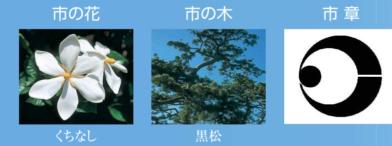
市の花 くちなし 市の木 黒松 市章