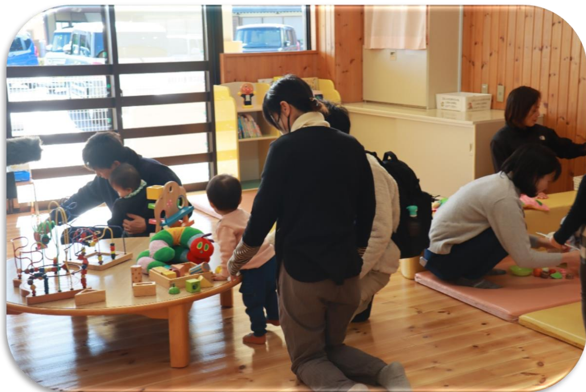
令和7年1月11日にオープンした新所子育て支援センター「にこりん」の様子