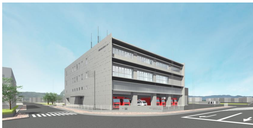
☞ 消防防災センター 完成予想図