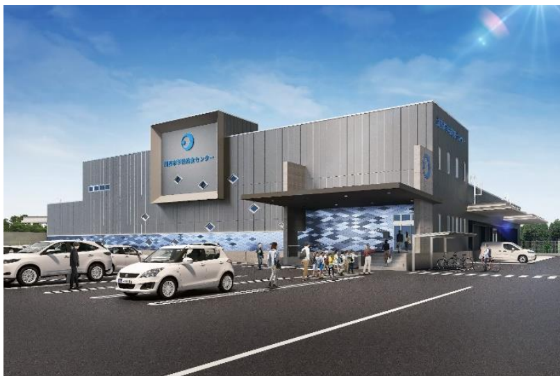
学校給食センター ☞ 完成予想図